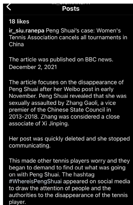
Рис. 2. Пример этапа опубликования отреферированной статьи Fig. 2. Publication of a rendered article

Первоначально студенты были разделены на 2 группы в зависимости от года обучения. Такое разделение определяется принципиальными отличиями их программ: 2 курс изучает деловой английский и навыки презентации на английском языке, а 3 курс работает с проблемами глобализации и перевода 3 . В зимнем семестре 2021–2022 учебного года автор исследования преподавал курс по созданию и представлению презентаций на английском языке, перевод с русского на английский, рендеринг и перевод с листа. Таким образом, виды блогерской деятельности были распределены для достижения конкретных целей в рамках указанных аспектов: студенты 2 курса должны были избавиться от страха говорить, общаться на английском спонтанно и регулярно, затрагивая вопросы повседневной жизни, обучения, тематику будущей профессиональной сферы; студенты 3 курса должны были осуществить обратный перевод (выбрать статью на русском языке в соответствии со своими предпочтениями, сделать реферирование русской статьи и затем перевести этот сжатый анализ на английский). Истории и видео не подвергались предварительной оценке со стороны преподавателя, он имел возможность ознакомиться с созданным контентом одновременно с остальной аудиторией, тогда как в случае перевода намеренно существовал этап предварительной оценки: студент присылал перевод преподавателю; обсуждались структура текста, ошибки в переводе, варианты исправления; утверждался конечный вариант; переводы были опубликованы (рис. 1, 2).