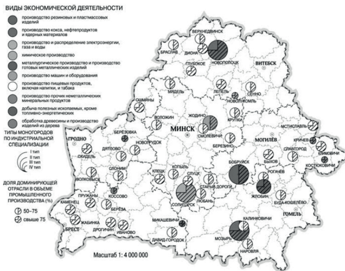
Рис. 2. Распределение монопрофильных городов Республики Беларусь по направлениям специализации градообразующего предприятия [6]