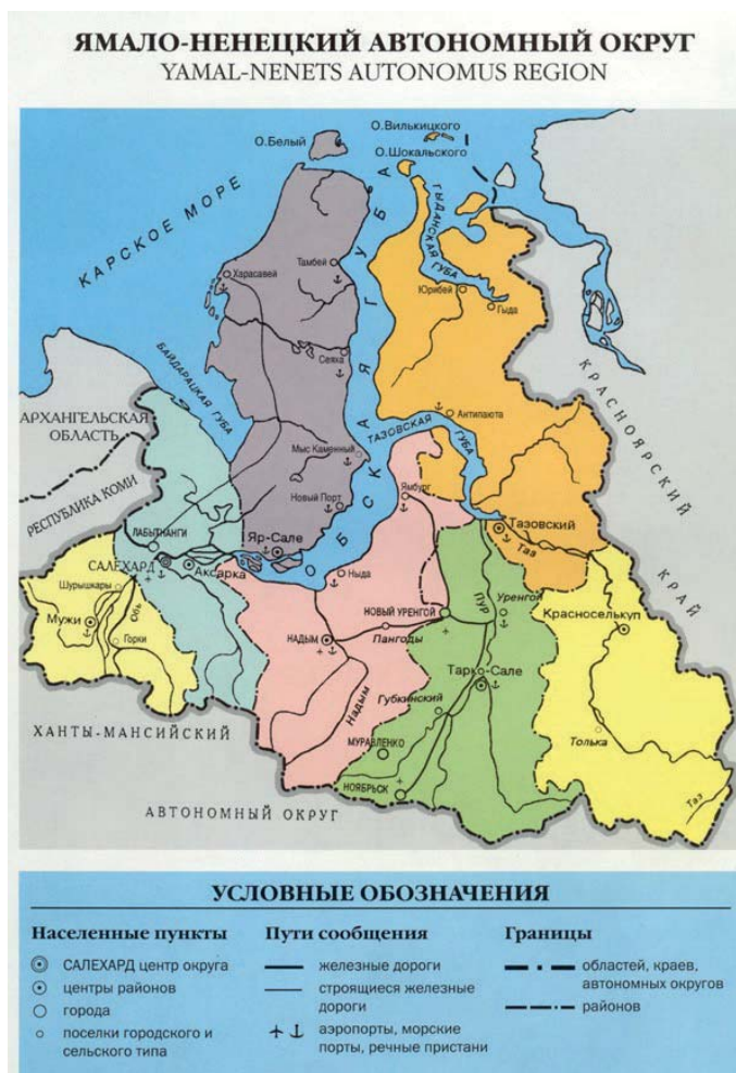
Рис. 2. Транспортная инфраструктура Ямало-Ненецкого автономного округа

Что касается развития туристской инфраструктуры, в регионе работает 38 турфирм, 67 гостиниц, 19 музеев, около 400 предприятий общественного питания. Государственная политика Правительства Ямало-Ненецкого автономного округа в сфере туризма направлена на развитие туристской инфраструктуры, продвижение местного тур-