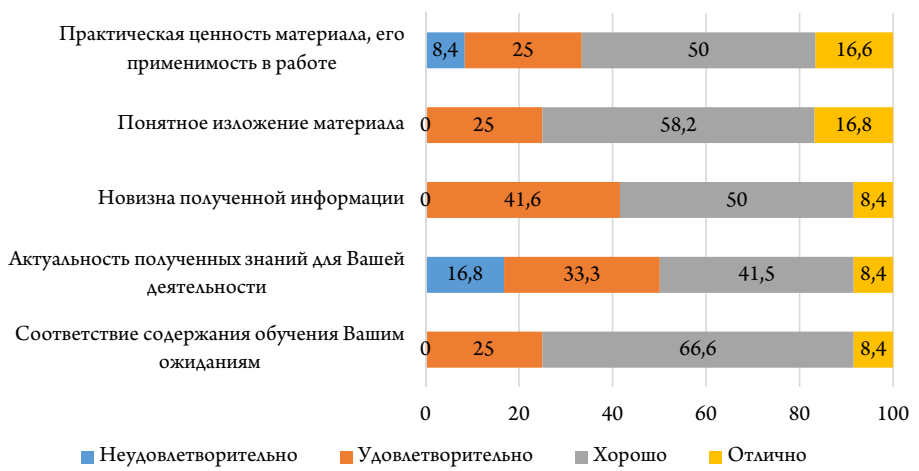
Puc. 4. Степень результативности обучения в системе «Олимпокс» Fig. 4. Assessment of the effectiveness of training in the Olympox system